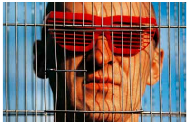
Spiel | Game Teil V, Berlin 1984

Lighter than Orange is an official selection of the New York City Independent Film Festival and will be screened at the festival on October 12-18, 2015.