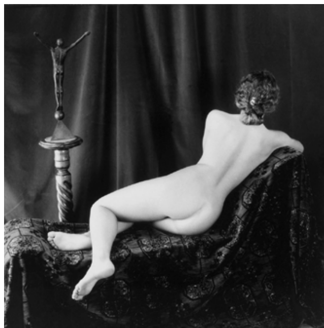
Rückenakt | Nude aus der Serie: Die Schönheit der Frauen | Female Beauty Berlin 1995

tät, oder heben sie lediglich den Prozess der Abbildung erkannter Wirklichkeit auf eine neue, technische Stufe, nämlich die der digitalen Generation von Projektionen, als menschlichen Vorstellungen, ohne daß damit die menschliche Erkenntnisfähigkeit einen Deut weitergekommen ist? Um Brecht abzuwandeln, was sagt ein computersimulierter Raum über die Wirklichkeit dahinter aus: über die Herrschafts-, Abhängigkeitsstrukturen etc. Es scheint zwar nicht mehr allzu fern, daß wir Marlene Dietrich und Humphrey Bogart und viele andere liebgewonnene Kinogrößen in computeranimierten, neuen Spielfilmen bewundern können und daß ihnen die neuen elektronischen Maschi-