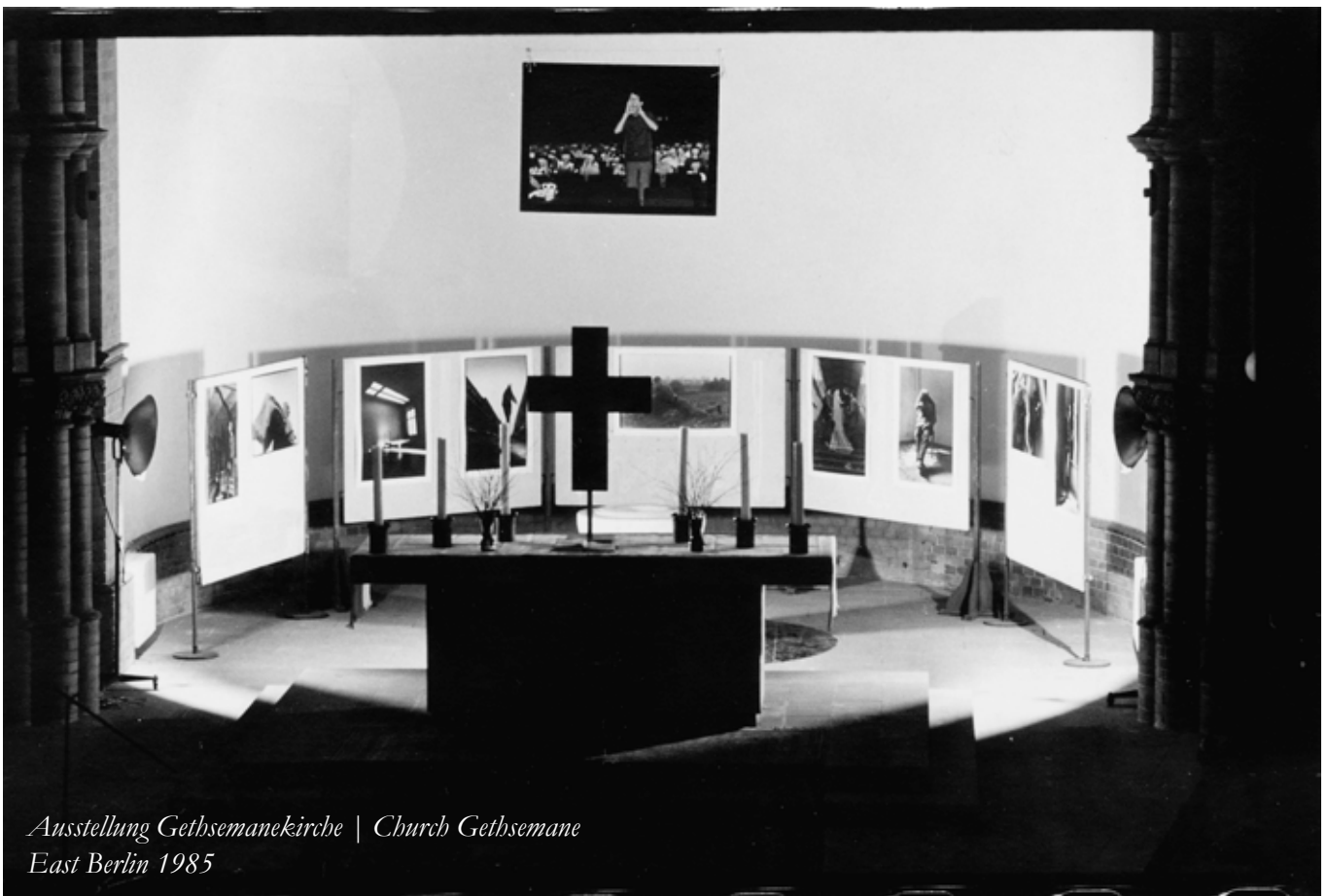
Ausstellung Gethsemanekirche | Church Gethsemane East Berlin 1985

T.O. Immisch , Matthias Leupold, Erfundene Bilder, Die Vergangenheit hat erst begonnen Schaden Verlag Köln, 2003